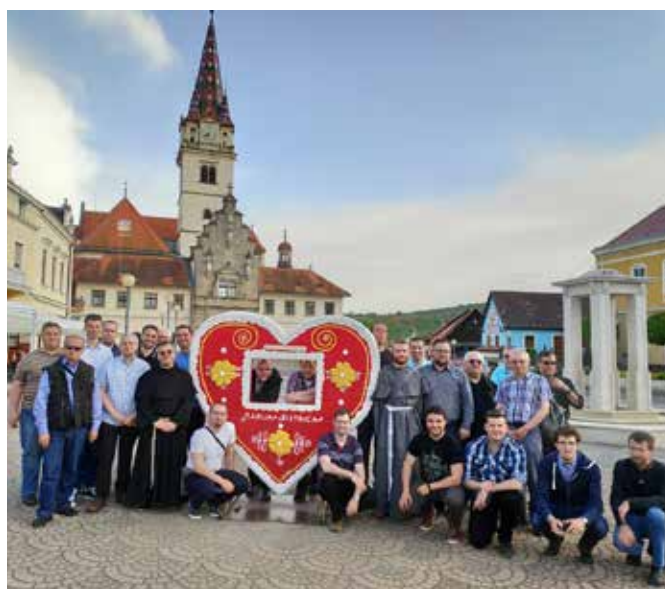
Tradicionalno srečanje ponovincev CEF-a – Hrvaška, Zagreb