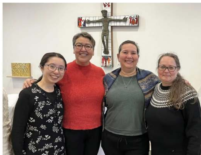
Udeleženske molitvenega srečanja za mir v katoliški cerkvi v Nuuku.