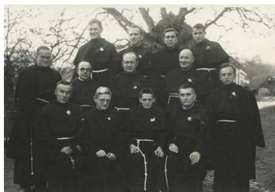
Nova maša pri Sv. Trojici (1955)

Ker večina ne pozna redovnikov, ki so na sliki, navajam še njihova imena: