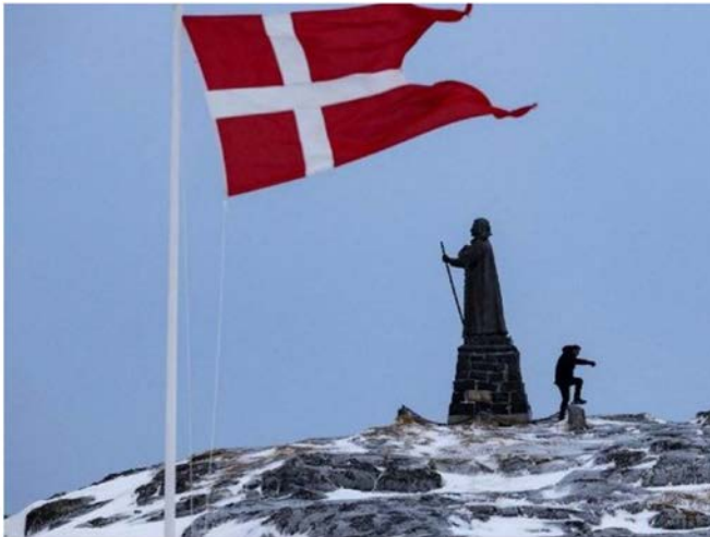
Danska zastava v grenlandski prestolnici Nuuk.

Grenlandija uradno pripada Danski, letošnja volilna kampanja pa je bila po navedbah STA zaznamovana tudi s sicer že desetletja trajajočo razpravo o morebitni neodvisnosti otoka. Danska Trumpove težnje po Grenlandiji odločno zavrača, grenlandski premier Mute Egede pa je poudaril, tako STA, da Grenlandija »ni na trgu« ter da si Grenlandci ne želijo biti niti Danci niti Američani, temveč želijo sami odločati o svoji prihodnosti.