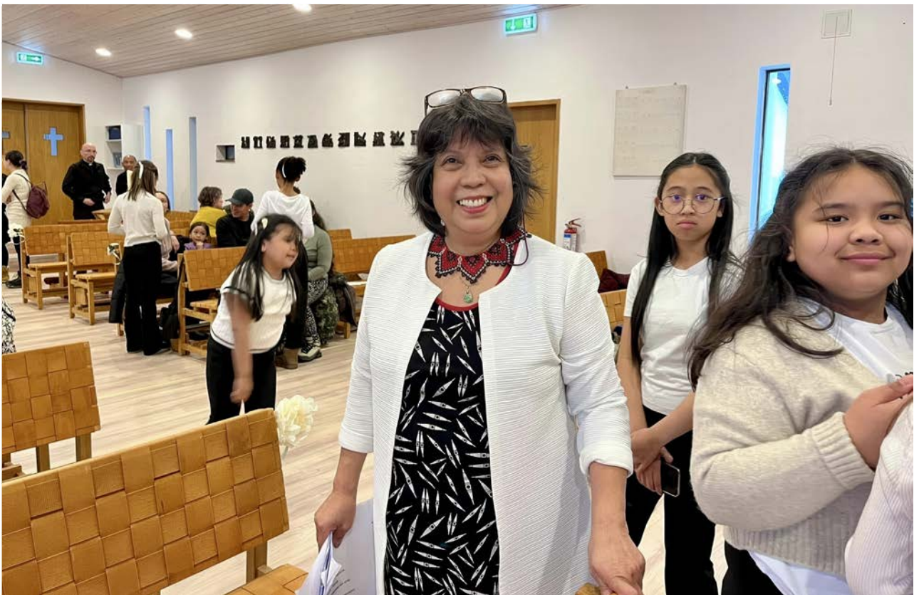
Veselo druženje po molitvi.