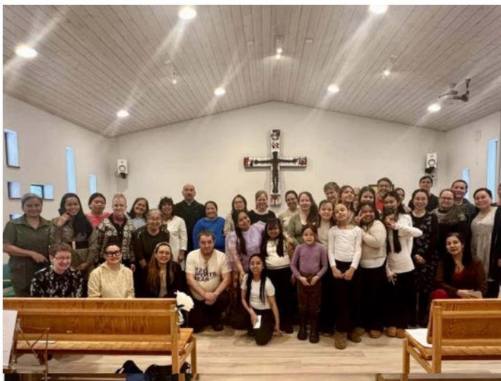
Ob letošnjem mednarodnem dnevu žena so v katoliški cerkvi v Nuuku pripravili molitveno srečanje za mir v svetu