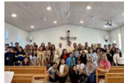
Marijino vnebovzetje na Grenlandiji z dvema slovenskima duhovnikoma

Med prebivalci Grenlandije je manj kot en odstotek katoličanov. Skoraj nihče izmed njih ni del staroselskega prebivalstva, ki ga etnično sestavljajo Inuiti in Danci. Tako kot na Islandiji so tudi na Grenlandiji številni katoličani delavci iz azijskih držav, Filipinov ali Vietnama, pa tudi iz nekaterih evropskih držav, ki so našli delo na polarnih območjih.