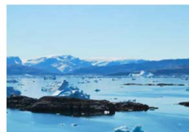
Tekma velesil za Arktiko

Prebivalci Grenlandije danes na volitvah odločajo o novem parlamentu: volitve so tokrat deležne precej večje pozornosti svetovne javnosti kot običajno, saj je ameriški predsednik Donald Trump od prevzema položaja v letošnjem januarju že večkrat izpostavil svoje težnje, da želi prevzeti nadzor nad otokom , ki je izjemno bogat z naravnimi viri.